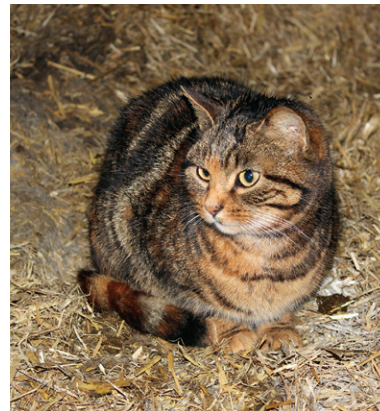
Katzen im Stall fangen nicht nur Mäuse, sie können auch Krankheitserreger einschleppen.

Ein weiteres Beispiel für die Bedeutsamkeit innerer Biosicherheitsmaßnahmen stellt die Bekämpfung der Paratuberkulose dar. Hat sich diese Tierseuche erst einmal in einem Bestand festgesetzt, so ist es aufgrund