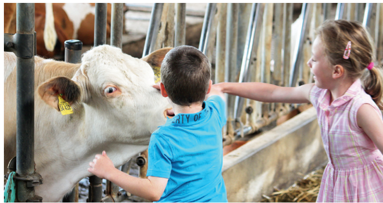
Tierkontakt: Personen können Krankheiten in einen Rinderbestand einschleppen, auch wenn das Streicheln der Tiere zu schön ist.

Zur Vermeidung dieser Erkrankungen ist es wichtig, den Keimdruck durch Hygienemaßnahmen bei Aufstallung, Fütterung und im täglichen Umgang zu minimieren sowie den Keimaustausch zwischen Tieren oder Tiergruppen so gering wie möglich zu halten. Auf der anderen Seite muss die Abwehrkraft der Tiere so gut wie möglich unterstützt werden. Beim Kalb ist die wesentlichste Maßnahme hierfür eine ausreichende Kolostrumversorgung. Neugeborene Kälber sollten in den ersten zwei Lebensstunden 3 l Erstkolostrum guter Qualität aufnehmen. Danach ist die weitere bedarfsgerechte Fütterung