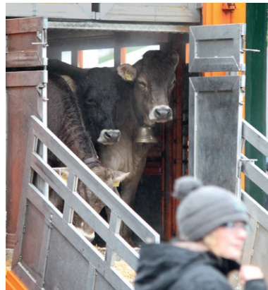
Betriebsfremde Fahrzeuge sollten innerbetriebliche Fahrwege nicht kreuzen.

(am besten Ad-libitum-Tränke) wesentlich für eine gute Immunitätslage des Kalbes. Gegen spezifische Krankheitserreger kann die Immunität natürlich auch über Impfungen verbessert werden.